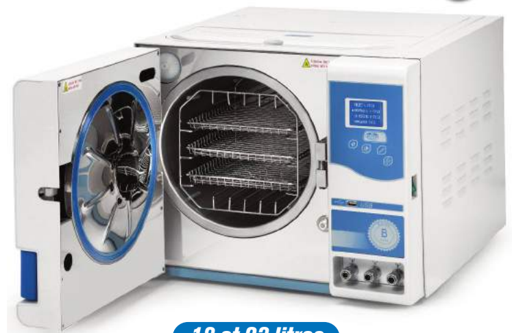
18 et 23 litres